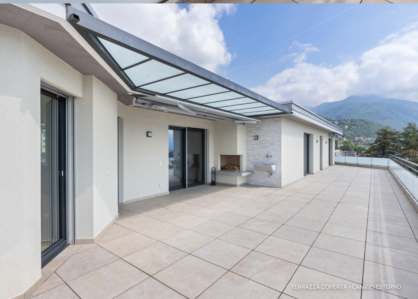
TERRAZZA COPERTA - CAMINO ESTERNO