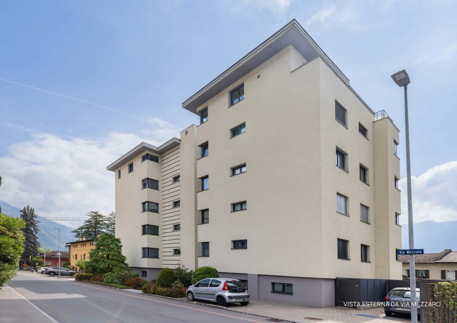
VISTA ESTERNA DA VIA MEZZARO