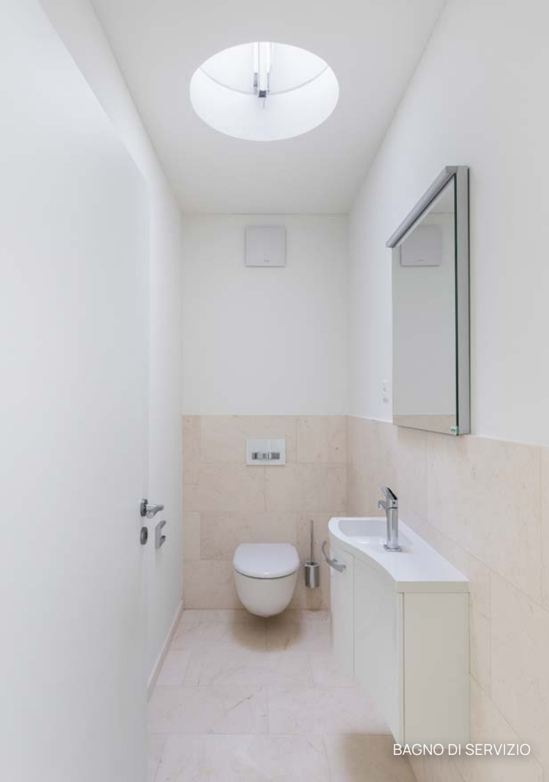
BAGNO DI SERVIZIO