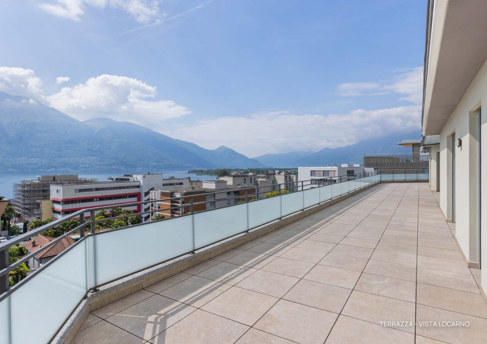
TERRAZZA - VISTA LOCARNO