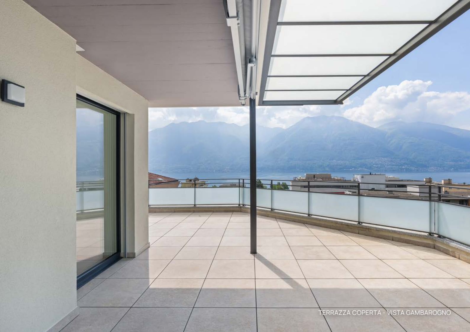
TERRAZZA COPERTA - VISTA GAMBAROGNO