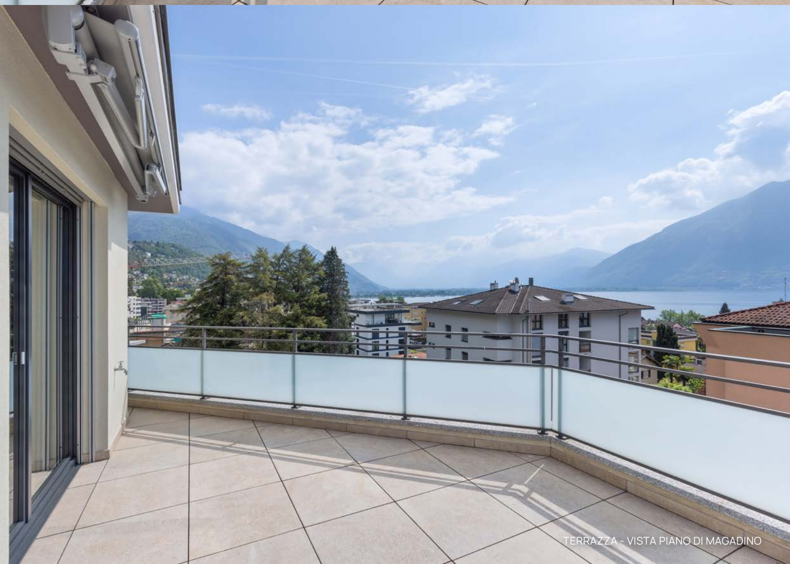
TERRAZZA - VISTA PIANO DI MAGADINO