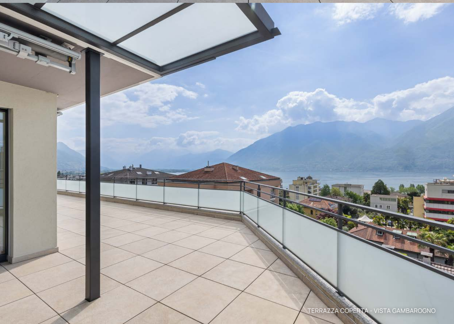
TERRAZZA COPERTA - VISTA GAMBAROGNO