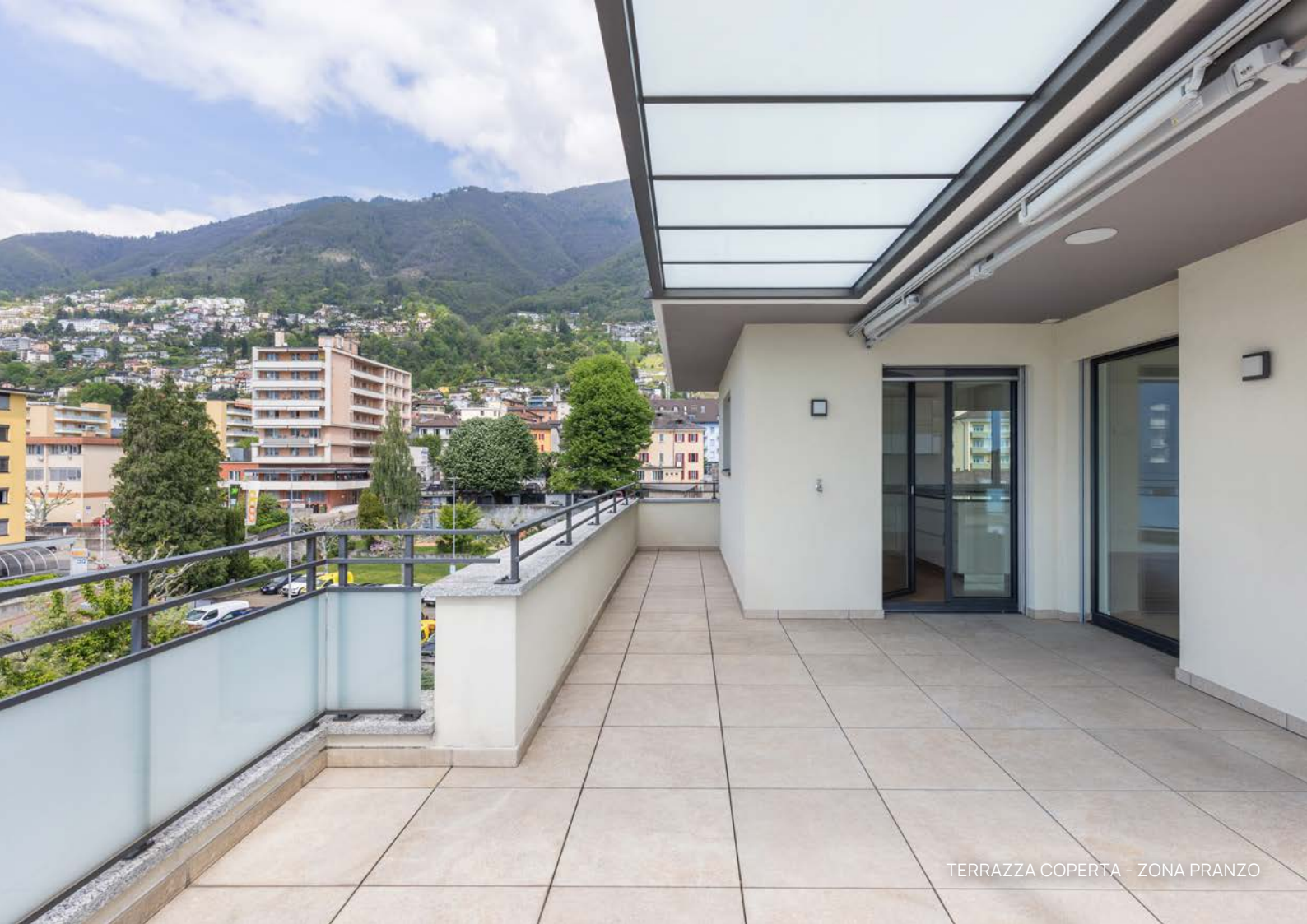
TERRAZZA COPERTA - ZONA PRANZO